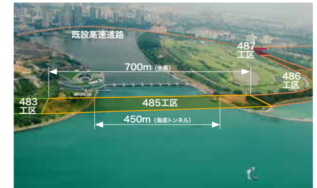
Marina Coastal Expressway(MCE)はシンガポールで10番目の高速道路。工区は6つに分かれ、五洋建設が受注したのは海底トンネルの区間を持つ485工区

ている。工区は6つに分かれ、当社が担当した「485工区」は、全長約700m、幅約55m、上下線合わせて10車線の大型2連ボックスカルバートだ。その半分以上を占める約450mが、シンガポール初の海底トンネルになる。