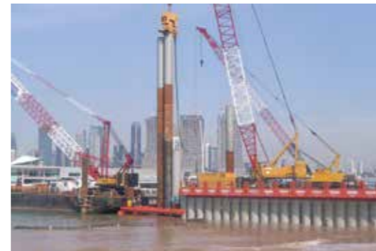
道路の線形に沿って鋼管矢板を2重に打設し、その上に構台を築く。鋼管矢板の内側には土砂を投入し、陸化していく

掘削部分の土質は軟弱粘土のため、大型の掘削機械では沈下の恐れがある。20台ほどの小型の掘削機械を投入し、掘削しては切梁を設置する作業を繰り返した。底盤まで掘削を終えれば、トンネル函体を構築し、海底地盤の高さまで土砂を埋め戻す。次はいよいよ、鋼管矢板の引き抜きである。