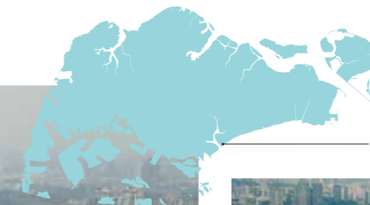
Marina Coastal Expressway MCE485工区

MCEは片側5車線の自動車専用道路で全長約5.3km。そのうち地下トンネル部は約3.6kmとなっ