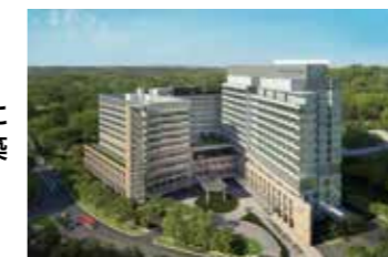
ノベナ病院 (2010年受注)