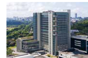
シンガポール国立大学病院 (2010年受注)