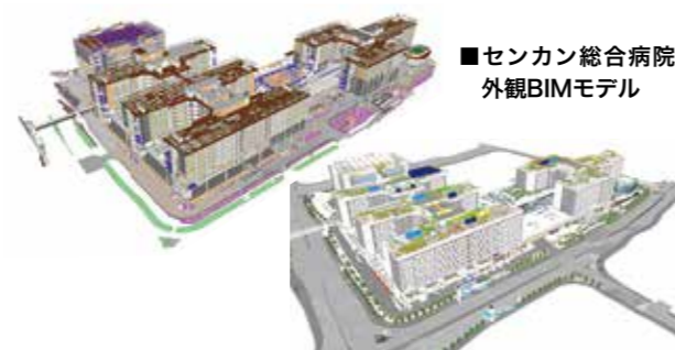
■センカン総合病院 外観BIMモデル

BIMを通じて3次元上で部材や設備の取り合いを調整した一例には、シェルターを構成する床や壁の配筋がある。このシェルターは、有事の際には緊急医療施設として機能するように設置された。周囲は厚さ2mほどの鉄筋コンクリート。「床や壁の取り合い部では鉄筋量が多くなるため、配筋を調整する必要がある。そこでBIMが役立つ」。ジョン・コーは評価する。