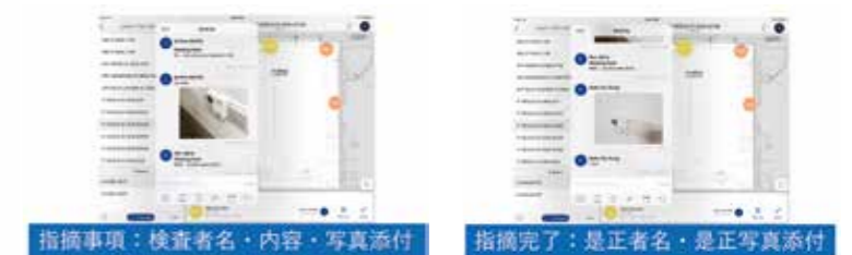
指摘事項：検査者名・内容・写真添付 指摘完了：是正者名・是正写真添付

引き渡し検査時の指摘事項を管理するシステムを導入。検査時に指摘された事項を図面上に記録する一方で、その内容や現場写真を検査者名と共に記録しておく。さらに是正時には是正者名と是正写真を記録する。建物規模が大きいために、この現場で指摘された事項はざっと14万件。その是正進捗状況は、iPad等のモバイルデバイスからクラウド上のシステムにアクセスすることで容易に管理確認ができる。