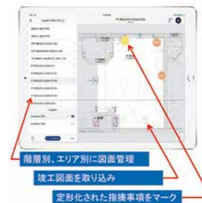
階層別、エリア別に図面管理 竣工図面を取り込み 定形化された指摘事項をマーク