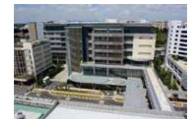
チャンギ総合病院 (2012年受注)

もとは2つの発注工事。それをあえてまとめ、1日当たり2億円の出来高を上げなくてはならない大工事を提案した。現場ではBIM(Building Information Modeling)や生産性向上を図るICT(情報通信技術)を駆使し、将来需要を見越した規模の病院建築を竣工まで導いた。