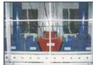
水圧接合原理確認試験の様子

最終継手の施工方法の一つ。鋼殻とコンクリートで構成するV字型の構造体「Vブロック」を起重機船で吊り上げ、海底に沈めながら、自重と水圧を利用して既設函の最終継手にはめ込んでいく。既設函に取り付けられたゴム部材の上を滑らせるようにVブロックをはめ込むと、そのゴム部材が次第に圧縮され、止水の機能を発揮する仕組みだ。Vブロックがゴム部材の上を滑りやすくなるように、その表面には海洋生物付着防止用の塗料を塗布し、表面平滑性を高めている。止水完了後はVブロック内の海水を排出。Vブロックと既設函内部を気中作業によって剛結合する。水深の深い現場や海水の濁りで見通しの悪い現場では、最終継手の施工を担ってきた潜水士の作業に安全性・施工性の問題が生じる。Vブロック工法はそうした問題を解決し、最終継手の安全・確実な施工を実現する。