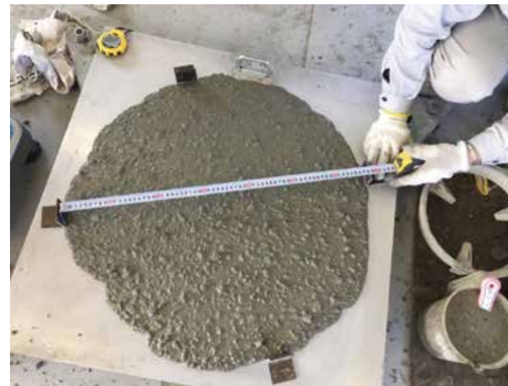
高流動コンクリート

材料分離の抵抗性を損なうことなく、流動性を高めたコンクリート。パイプレーターなどによる締め固めなしに打設できる。Vブロックは鋼殻の構造体内にコンクリートを打ち込む鋼・コンクリートサンドイッチ合成構造。鋼殻内は作業員が立ち入れないことから、締め固め不要の流動性の高いコンクリートが必要とされた。大阪港咲洲トンネルでは、運輸省港湾技術研究所(当時)と民間11社の共同研究で開発された高流動コンクリートを用いた。