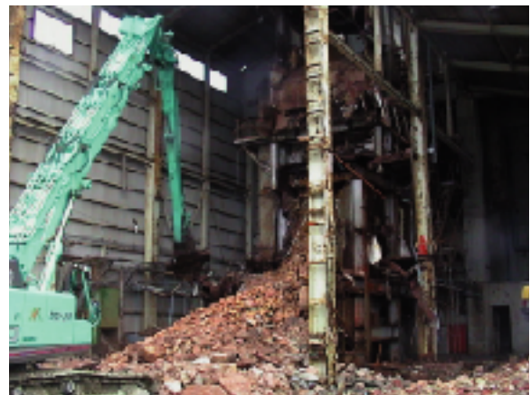
鉄骨切断機による焼却炉の解体状況