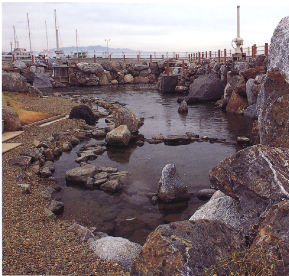
岩を巧みに積んで磯を再現